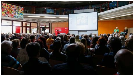
Les manifestations publiques impliquant la diffusion de vidéos d'archives sont très appréciées.

Les unités d'entreprise proposent une sélection de perles d'archives sur leurs sites web , sur les plateformes de réseaux sociaux , dans des installations ou lors d' événements . Les événements locaux et les journées portes ouvertes organisés par les Archives ont par ailleurs connu un franc succès.