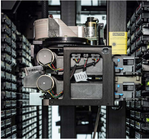
Les contenus d'archives sont conservés à la fois dans des systèmes robotisés et sous forme de copies de sécurité.

Les contenus sont inventoriés correctement afin qu'ils puissent être trouvés selon des critères de recherche tels que le lieu, la date, les personnes impliquées, les auteurs, etc. L'intelligence artificielle est de plus en plus utilisée pour l'inventaire des contenus d'archives.